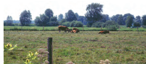
Rinderweide vor Riedhausen

Die Verträge sehen die Unterstützung von extensiver Beweidung sowie die Neuschaffung und Etablierung von extensiver Grünlandnutzung unter gezielter Be-