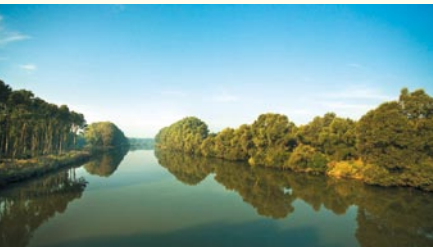
Donau zwischen Gundelfingen und Dillingen

Typische Brutvögel sind Weißstorch, Kiebitz und Großer Brachvogel. Zu den Rastvögeln zählen Kranich und Rotschenkel, Wintergäste sind Singschwan, Kornweihe und Silberreiher.