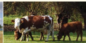
Extensive Mutterkuhhaltung, Blindheim